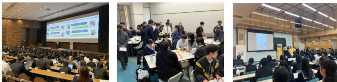
▲2025 年ブロック大会での活動の様子

選考に先駆けて、事前学習の場として、「SB Student Ambassador ブロック大会」を全国 9 地域で実施し、合計 226 校 1,622 名の皆様にご参加いただきました。