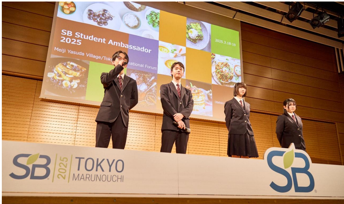
▲第 5 回 SB Student Ambassador 全国大会の様子